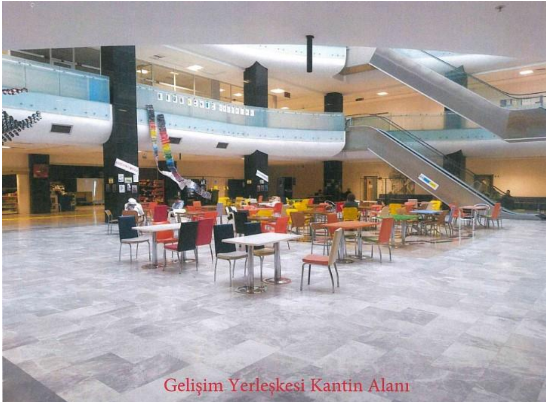
Gelişim Yerleşkesi Kantin Alanı